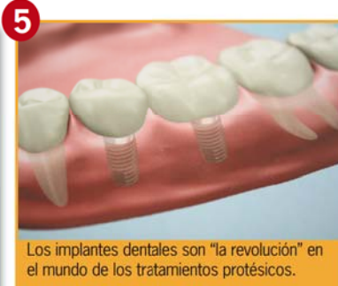
Los implantes dentales son "la revolución" en el mundo de los tratamientos protésicos.